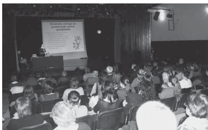
Tribina u Sisku

S početkom u 17 sati održana je javna tribina u Sisku na adresi Kazalište 21.