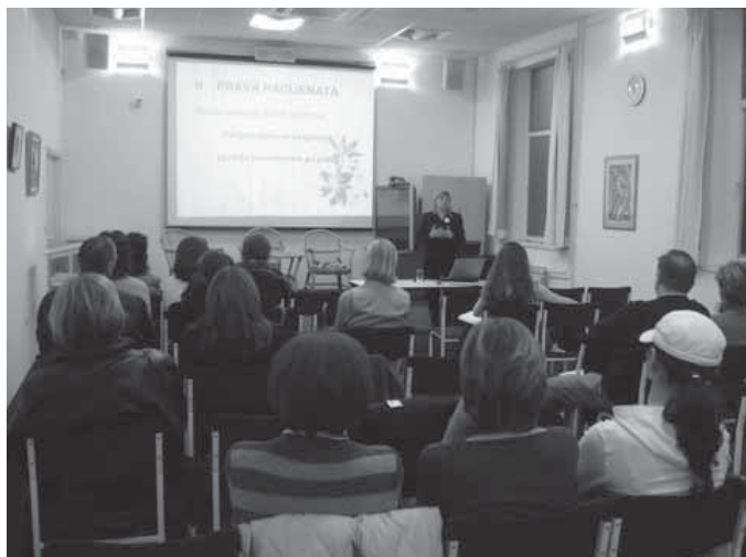
Javna tribina u Gradskoj knjižnici u Zadru

Tijekom jutra održana je tiskovna konferencija na kojoj su izneseni planovi za rad u 2009. godini, upozoreno na izostanak suradnje te nedemokratske načine predavljanja i provođenja reformskih procesa. Upozorilo se na tešku poziciju pacijenata koji se ne mogu snaći u predloženim reformskim mjerama kada to očito ne mogu ni liječnici kako je vidljivo kroz dugotrajno protestiranje liječnika opće medicine. Poslana je poruka javnosti da zatraži jasnije i glasnije svoja prava na informaciju i odluku kada je u pitanju sam sustav te je naglašeno kako bez korištenja toga prava reforma neće imati povoljne reperkusije na građane.